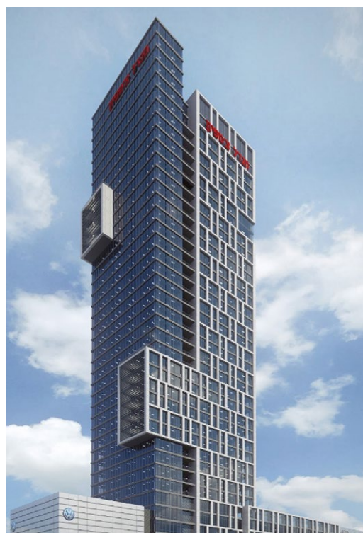
בית מיטב דש