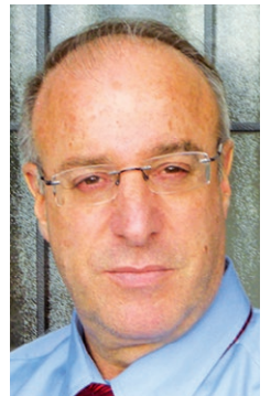
מאת עו"ד ג'ון גבע

בבית משפט השלום בתל אביב-יפו נדונה תביעתו של פלוני (התובע) כנגד אגודת בית הכנסת (הנתבעת) וכנגד מגדל חברה לביטוח בע"מ (הנתבעת 2). שמות באי כוח הצדדים לא צוינו בפסק הדין (ת"א 18-22497-02), אשר ניתן במאי 2021, מפי השופטת עידית קצבוי.